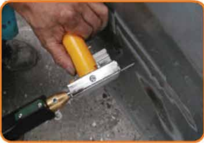
①Pワッシャー密着溶接