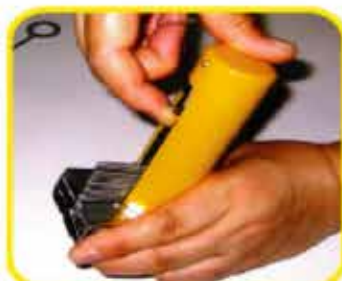
7溶接機ホルダーに取り付ける