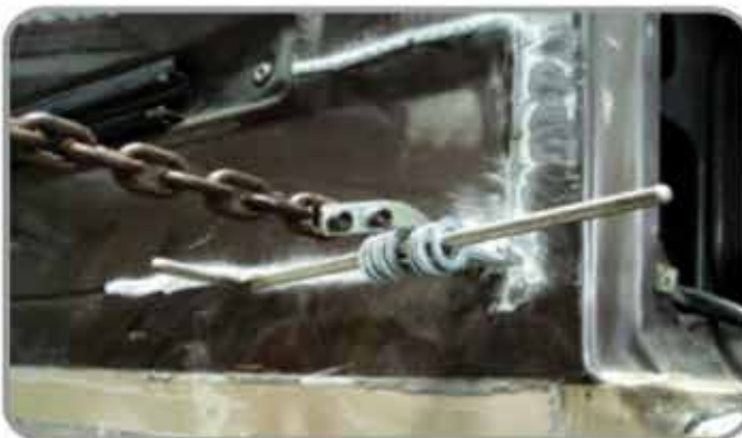
4・ジワーっと引いて