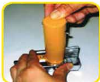
5ロックレバーを閉じる