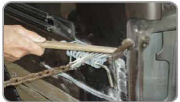
5・パネルを引いてハンマリング