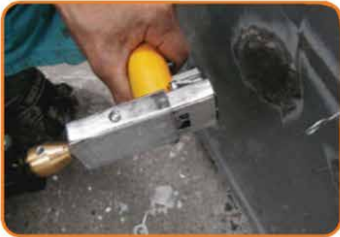
③カセットトリガーを引く