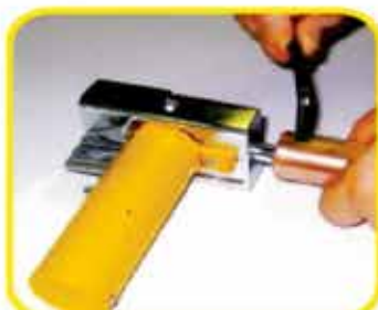
6レバーを外しワッシャーに静かに当てる