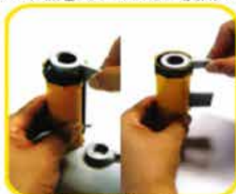
3ワッシャーを入れる