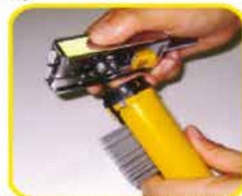
4プッシュホルダーを取り付ける