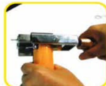
8一回引いてワッシャーの先を溶接できるように出す