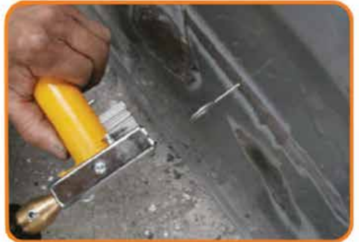
②引き抜いて取り外し