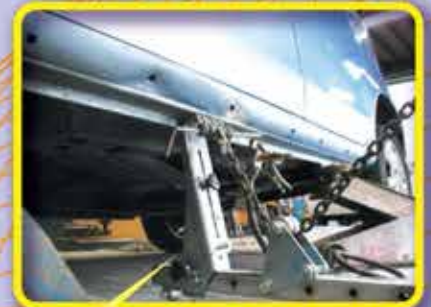
プルーラとの併用